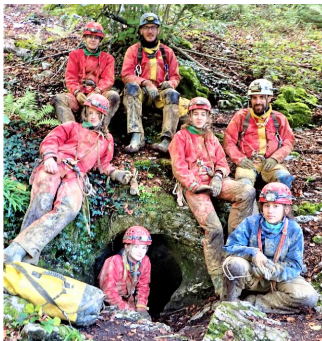
L'EDS à la grotte de Vaulx St Sulpice