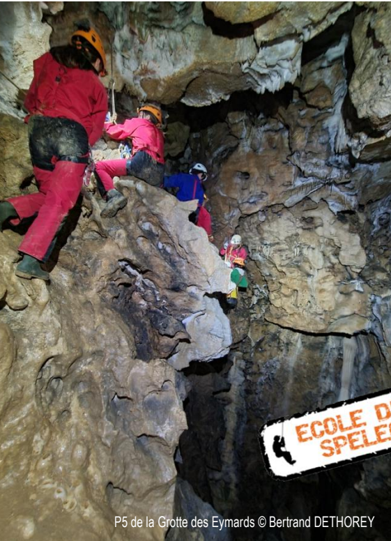
P5 de la Grotte des Eymards

Après quelques rappels, nous entamons la descente du premier puits en sortie duquel, à ma grande surprise, nous croisons toute une famille de salamandres : soit une vingtaine de salamandres entre 3 et 20 cm chacune.