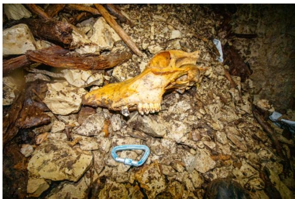
Ebolis au fond du gouffre