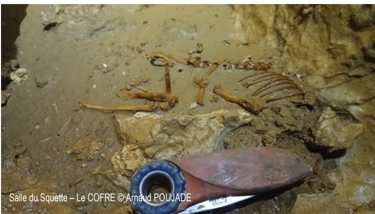
Salle du Squette - Le COFRE