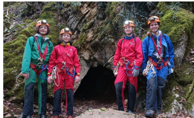
Nos 4 nouvelles recrues devant la grotte de Jujurieux

Durant ce premier trimestre, les sorties sur le terrain ont eu lieu une fois par mois avec en prime un WE entier à Méaudre dans le Vercors en novembre dernier.