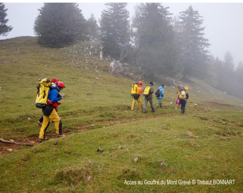
Accès au Gouffre du Mont Grévé

Poupou, Agathe, Rémi et Thibaut TPST : 3 h + 2 h 30 Rédigé par Thibaut