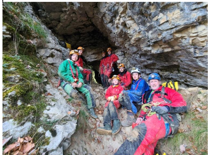
Entrée de la Grotte des Eymards

Un peu avant de remonter, Gabrielle commence à ne pas se sentir bien, puis juste avant de monter le P28 elle ressemble à un cadavre. Bertrand la remonte grâce un balancier espagnol sur le P28 équipé en double. Hugo déséquipe.