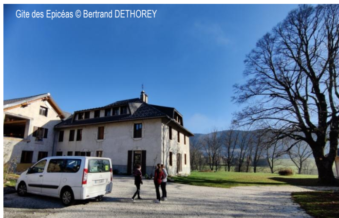
Gîte des Epicéas

Après une heure de marche, nous sommes unanimes sur le fait qu'ils ne nous ont pas attendus et que nous avons loupé le chemin. Nous espérons juste que Gaby et Cassandre sont bien avec le groupe de tête. Nous faisons donc demi-tour pour retourner à la voiture. Nous y retrouvons le reste du groupe à 13 h 15.